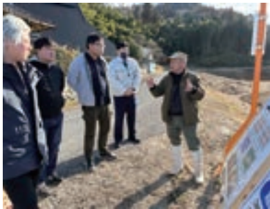
▲地下水抑制システムの説明を受ける参加者