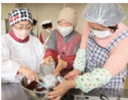
▲米粉を使ったお菓子を作る参加者

JAひろしま女性部の庄原地区本部庄原支部グループ「シャイン」は2月8日、JA庄原支店でセミナーを開きました。9