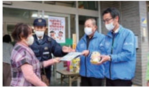
▲チラシなどで特殊詐欺防止を呼び掛け

JA甲奴支店ふれあい委員会は2月15日、支店で特殊詐欺防止に向け、啓発活動を行いました。三次警察署甲奴駐在所と甲奴町振興協議会連合会と連携。年金支給日に合わせて、8人がチラシなどを配布しました。 窓口やATMの利用者に、詐欺の特徴や傾向を説明。①固定電話のナンバーディスプレイ機能や留守番電話機能の利用、②ATMの利用限度額の変更などの対策を紹介し、啓発グッズなどを手渡しました。