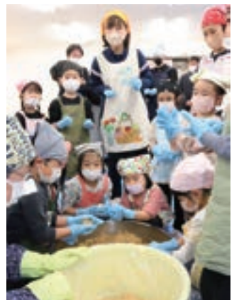
▲みそ玉を作る参加者

JA比婆西城支店ふれあい委員会は2月15日、支店で初めてのふれあい活動を行いました。西城保育所の園児12人と庄原市立西城中学校の生徒15人が参加。JA女性部みそ加工グループが長年続けるみそ造りに挑戦しました。 女性部員が蒸した米に麴を混ぜる作業や大豆を蒸す作業などのみそ造りの工程を説明しまし